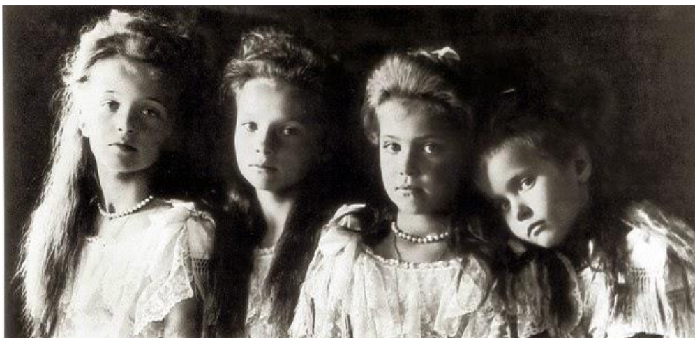
Olga, Taťána, Marie a Anastázie

Údajné ostatky cara a jeho rodiny nalezené v jámě při lesní cestě u Jekatěrinburku byly v roce 1991 exhumovány, byla provedena jejich identifikace ( samozřejmě s kladným výsledkem ) a znovu slavně pohřbeny v roce 1998 v kryptě katedrály sv. Petra a Pavla v Petrohradu . Je však zajímavé, že patriarcha odmítl sloužit bohoslužbu a poslal za sebe svého zástupce, který se ale měl modlit pouze za " neznámé služebníky Boží ". ( Oni vždycky vědí víc! )