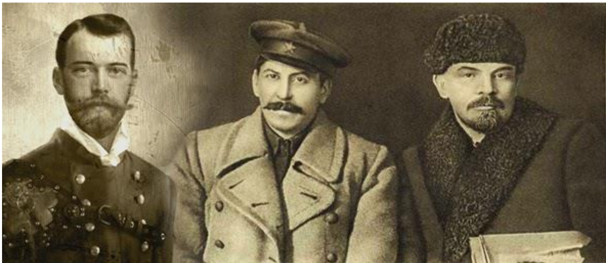
Car Nikolaj II. Stalin a Lenin

A teď už je myslím nad slunce jasnější, proč Stalin projevil tolik umu, aby carskou rodinu zachránil. A také už víme, proč občas opouštěl Moskvu a pokud možno tajně putoval do nějakých sto kilometrů vzdáleného města Serpuchov . V předchozí části už totiž zaznělo, že tam měl bratrance – dobře ukrytého a pod cizím jménem žijícího Nikolaje Romanova . Ty cesty se Sovětskému svazu vyplatily. Stalin totiž od Nikolaje zřejmě získal kódy umožňující přístup k pohádkovému bohatství Romanovců, a tak z jeho části se podařilo zemi připravit na blížící se válku.