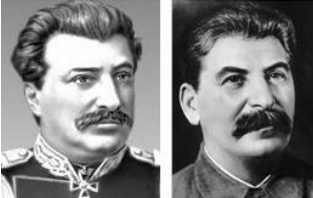
Nikolaj Michajlovič Przewalský a Josif Džugašvili

A tohle jméno vám taky asi něco říká... Pokud by vám snad bylo divné, proč pak na tohoto chlapce Przewalský až do své smrti posílal pravidelně peníze, podívejte se na jejich fotografie.