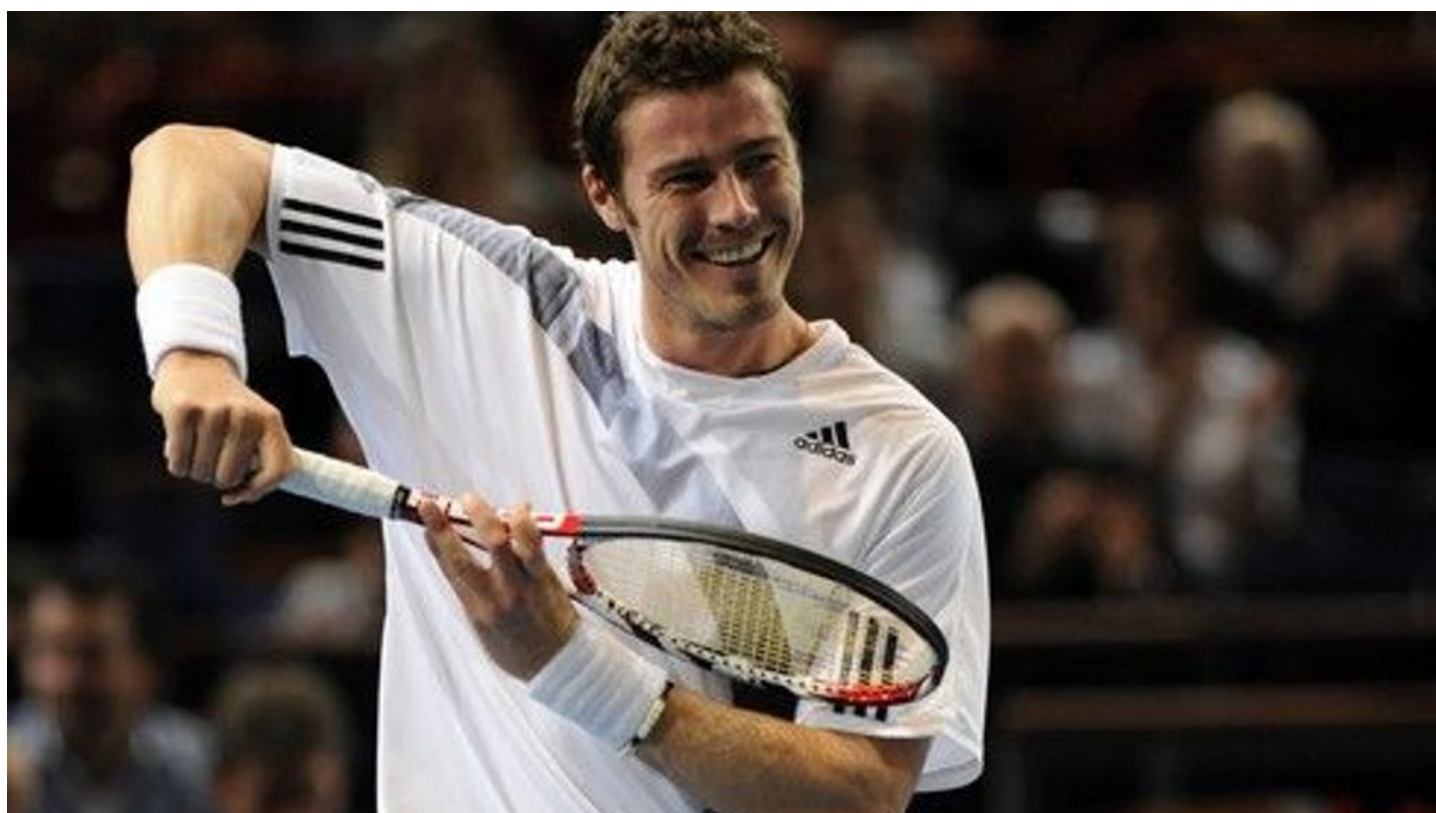
Marat Safin.