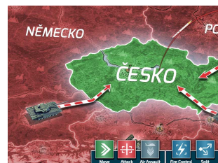
Simulace 3. světové války

Vďaka USA takmer nefunguje OSN. Američania jednostranne vypovedajú existujúce zmluvy, porušujú medzinárodné právo a odhodili bokom všetky demokratické princípy. Spoliehajú sa už len na svoju vojenskú moc a na to, že môžu slabším krajinám diktovať svoje predstavy.